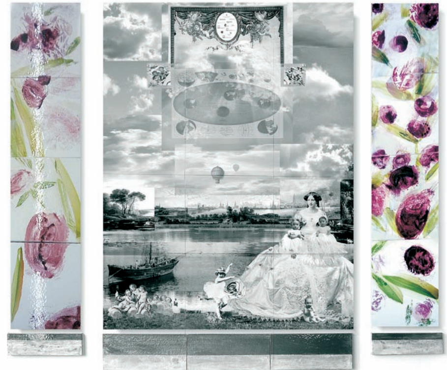
„Südwestdeutsche Landschaft mit Allegorie der Caritas“ Triptychon, Majolikamalerei und Siebdrucktechnik auf weißen Scherben, 170 x 200 x 2 cm, Kirchliches Rechenzentrum, Südwestdeutschland, Eggenstein 2012