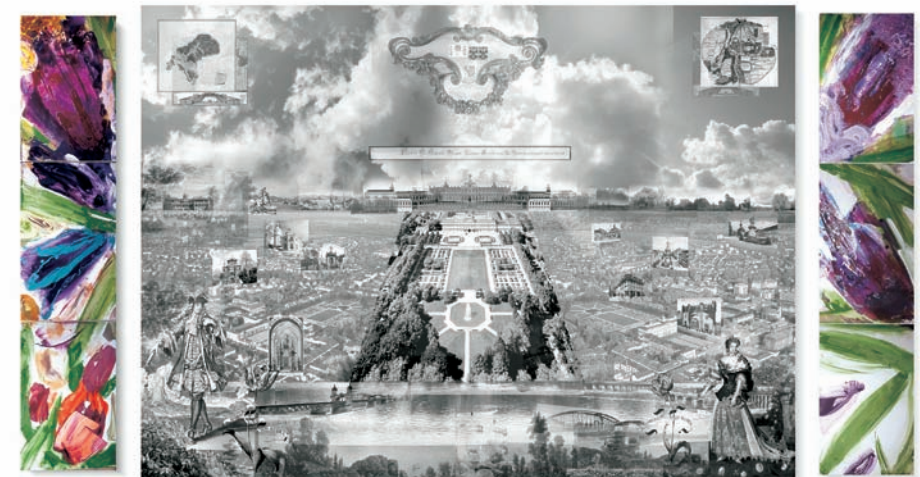
„Stadtpanorama mit Hervorhebung der barocken Wurzeln“ Majolikamalerei und Siebdrucktechnik auf weißen Scherben, 135 x 210 x 2 cm, Keramisches Majolika-Wandgemälde für den Private-Banking-Bereich der Volksbank Baden-Baden Rastatt, Rastatt, 2014.