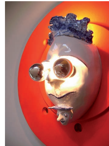
unten: Vorarbeiten für den Brunnen am Clara-Immerwahr-Haber-Platz, Karlsruhe (Südoststadt)