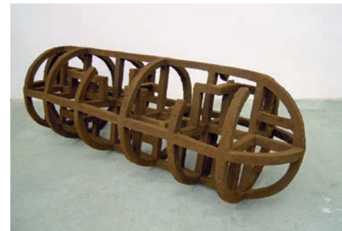
Raumlabyrinth II, 2013