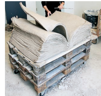
„Foliant“, Max-Planck-Institut für Rechtsgeschichte, Frankfurt