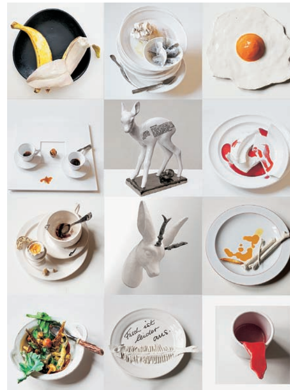
aus dem Werkzyklus „Mahlzeit“

Kunst im öffentlichen Raum: Standesamt Bühl & Ettlingen; BBBank Rastatt; Karstadt, ECE-Center, Duale Hochschule, Hauptstelle Sparkasse Karlsruhe Ettlingen, Badische Landesbibliothek, Karlsruhe; Einzelausstellungen (Auswahl): Städtische Galerie, Museum Ettlingen; Stadt Bühl Friedrichsbau; Kreisverwaltung Südliche Weinstraße, Landau; BB-Bank Karlsruhe; Centre Culturel, Bischwiller, Frankreich; Kunsthalle im Reitstadel, Neumarkt; Villa Wieser, Herxheim; Kunstverein Amtsgericht, Schwetzingen; Städtische Galerie Altes Rathaus, Wörth am Rhein; Ausstellungenbeteiligungen im In- und Ausland