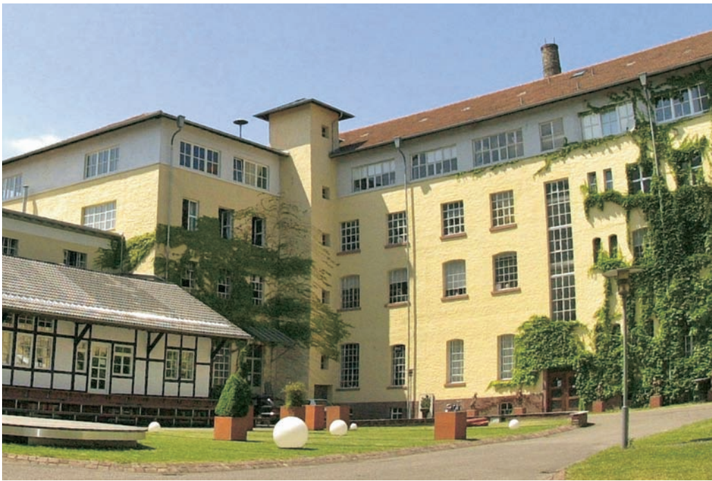
Innenhof der Majolika Manufaktur