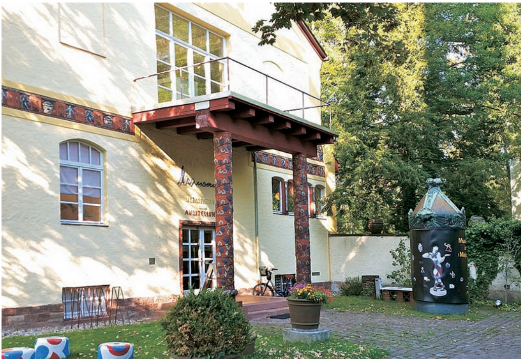
Eingang zum Majolika Museum

gehen neue Wege, öffnen neue Tore, sind Spiegelbild ihrer Zeit und Vorreiter für neue Entwicklungen.