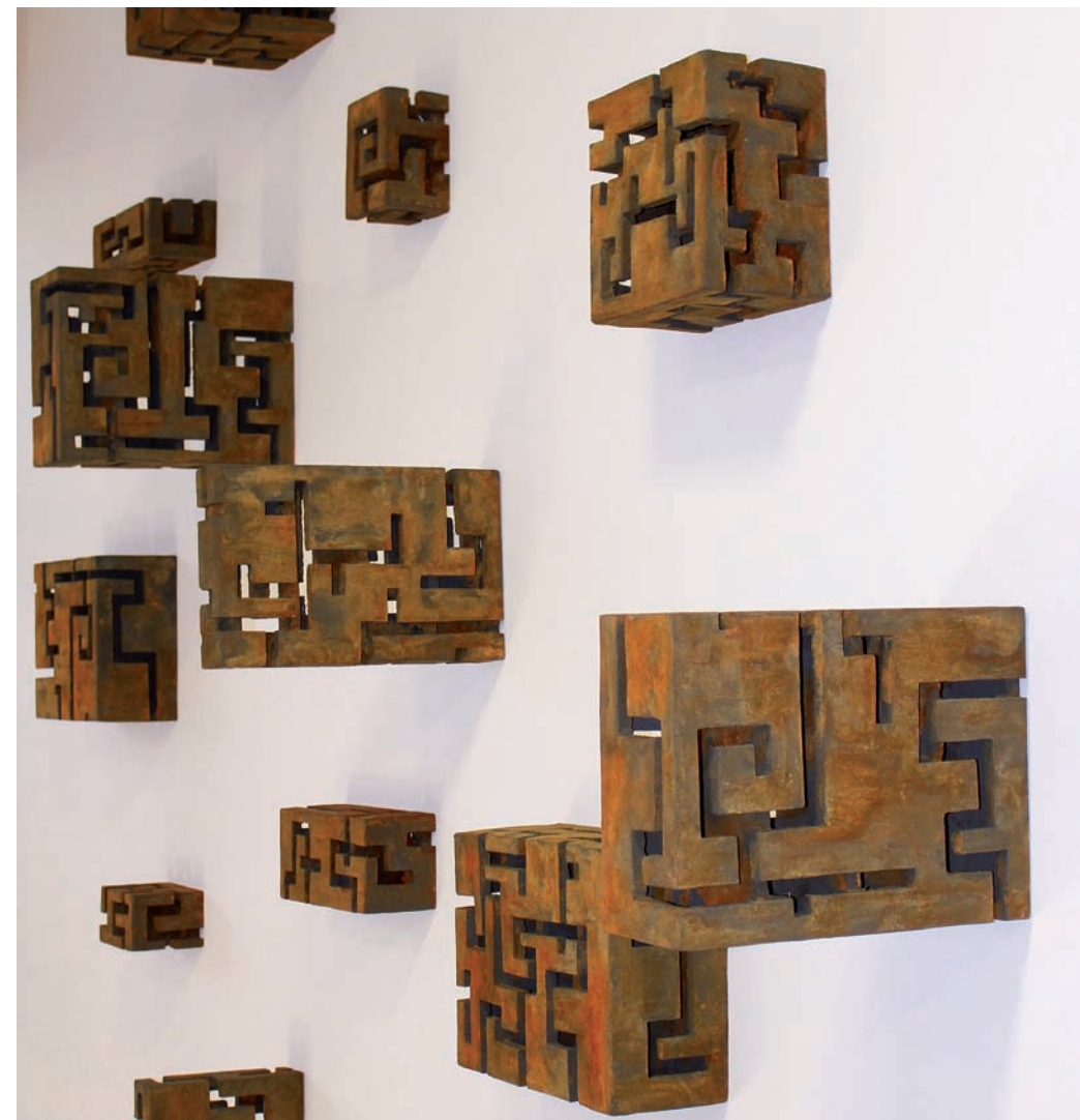
Labyrinthkästen im Generallandesarchiv Baden-Württemberg, Karlsruhe 2014

Einzelausstellungen (Auswahl): 2015 Münsterländer Kunstverein Coesfeld (D); 2014 Kunst- raum St. Georgen Wismar (D), 2012 Palazzo Minucci-Solaini-Pinacoteca e museo civico Volterra (I); 2011 Hohenloher Kunstverein Langenburg (D), Galerie der Staatlichen Majo- lika Manufaktur Karlsruhe (D); 2010 Krefelder Kunstverein (D); 2009 Kunstverein Bay- reuth (D); 2008 Jüdisches Museum Rendsburg (D), Kunstverein Husum (D); 2007 Granit- museum Hauzenberg/Passau (D); 2006 Kunstverein Germersheim (D); 2005 Münchner Künstlerhaus am Lenbachplatz (D); 2004 Kunstverein Würzburg (D); 2003 Chapelle de la Salpêtrière Paris (F), Galerie Brûlée Strasbourg (F); 2002 Museum Elzenveld Antwerpen (B); 2001 Forum Konkrete Kunst Erfurt (D), 2000 Kulturfabrik Krefeld (D); 1999 Badi- sches Landesmuseum Schloss Bruchsal (D), Buchmesse Frankfurt – One Man Show – Galerie Knabe Berlin (D); 1998 Palazzo Ducale-Centro d'arte contemporanea Revere/ Mantua (I); 1996 Palazzo Datini Prato (I), Ehemalige Synagoge Gelnhausen (D), Galerie Schuhwirth & van Noorden Maastricht (NL); 1995 Kunstverein Paderborn (D); 1994 Usinor Sacilor – Espace Acier Paris-La Defense (F), Jadite Galleries New York (USA), Galerie Wieneke Köln; 1993 Kunsthaus Nürnberg (D), Kunstverein Heidenheim (D), Place des Arts – Ministère de Finances Paris-Bercy (F), Galerie du Pavillon Royale Paris (F); 1992 Galeria Aglaiä Florenz (I); 1987 Künstlerhaus Karlsruhe (D) www.guenterwagner.de