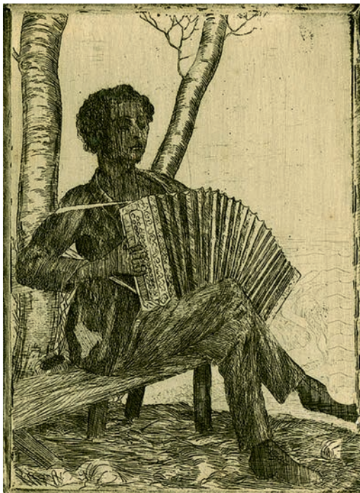
»Bruder Fritz Babberger-Herzog beim Handorgel spielen«, n. d., Radierung, 18 x 13,3 cm (Platte), 18, 1 x 13,4 cm (Blatt), Inv. Nr. 178, 2000, Schenkung aus Privatbesitz.

blume wuchs, Rührmichnichtan, sonst platzte ihre Frucht. Eine Herrlichkeit tut sich auf, die jene Jahre erfüllte, dass ich gut begreife, wie ich in Florenz davon träumte, teils sie noch verschönend bis zum Märchen in grosse Ueppigkeit hinein oder in Angst, das Dorf würde durch neue Häuser verdorben und verbaut. Liebe und Sorge haben mich so erfüllt, was ich immer aus dem Traum erfahren habe und Heimweh spürte ich zum ersten und stärks-