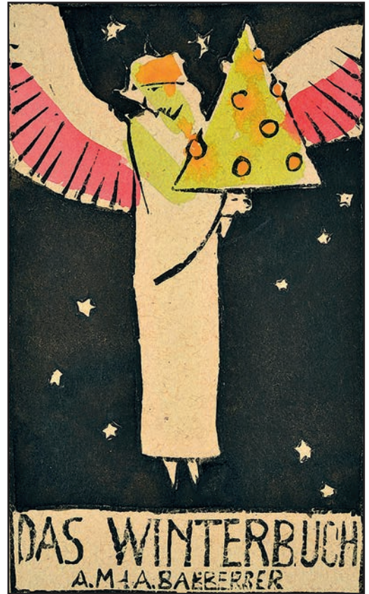
August Babberger und Anna Maria Babberger-Tobler: »Das Winterbuch«, 1934, (Titelseite), Holzschnitt, aquarelliert, 53,3 x 43 cm (Blatt), Inv. Nr. 175, Schenkung aus Privatbesitz.