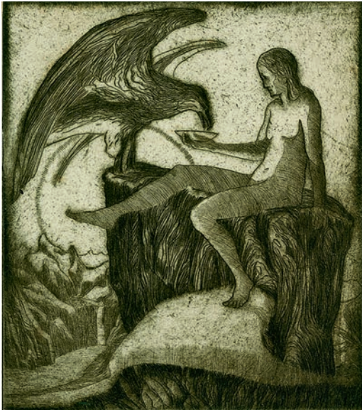
»Am Morgen«, n. d., Radierung, 20 x 17,3 cm (Platte), 24,6 x 20,1 cm (Blatt), Inv. Nr. 179, Schenkung aus Privatbesitz.