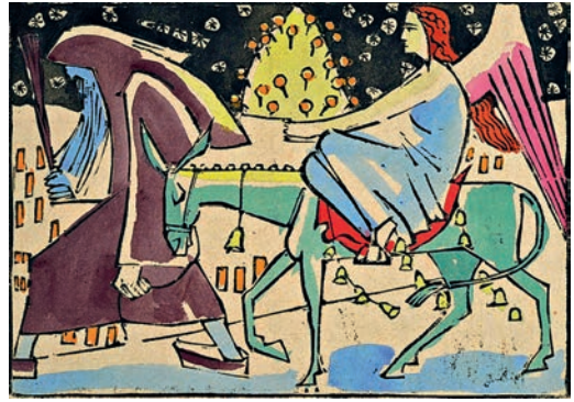
August Babberger und Anna Maria Babberger-Tobler: »Das Winterbuch«, 1934, Blatt 9, 43 x 53,3 cm, Inv. Nr. 175-9.

ten Mal, als ich mit meinen Eltern nach Basel kam, wo ich in einem Gartenweg mich im Schmerz wälzte. Ich hatte keinen Menschen vermisst, denn die Eltern waren ja da und der Bruder und das Fernsein von meiner Schwester, die ich am meisten liebte, musste ich mir schon angewöhnt haben.