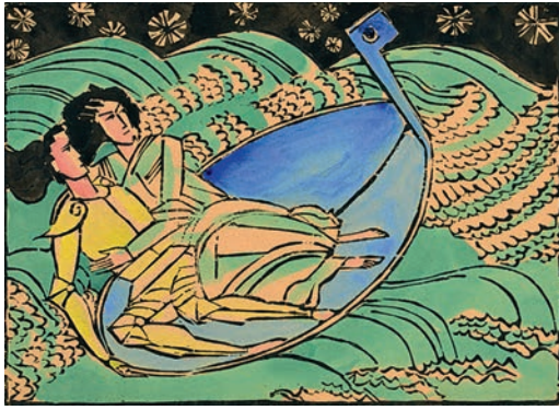
»Die Hochzeitsreise«, nicht datiert, Holzschnitt, aquarelliert, 33 x 50 cm (Blatt), Inv. Nr. 176-1-8, 2000, Schenkung aus Privatbesitz.